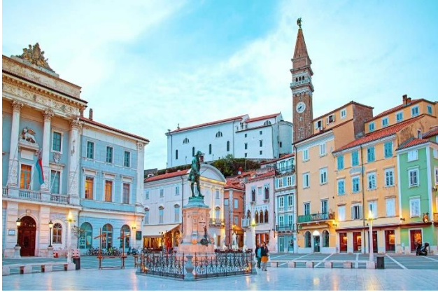
SLIKA 6 Tartinijev trg