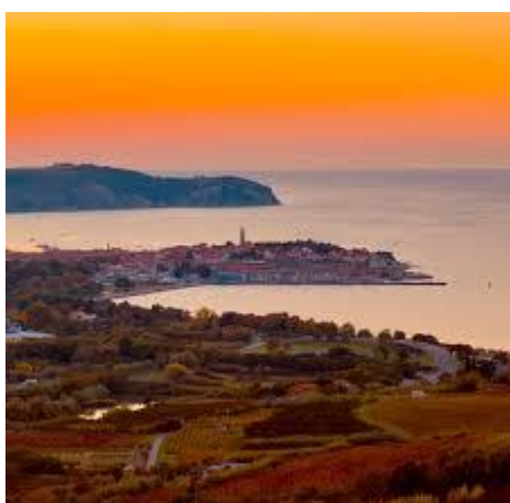
SLIKA 12 obala

Program je časovno in organizacijsko izvedljiv, cenovno realen ter prilagojen skupini do 30 oseb. Zaradi raznolikosti in vsebinske bogatosti je primeren za različne ciljne skupine, kot so dijaki, starejši ljudje, družine in organizirane skupine.