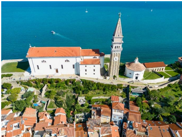
SLIKA 7 cerkev sv. Jurija

Nato pa se bodo po starih ozkih piranskih ulicah povzpeli do cerkve sv. Jurija, katera je zgrajena v beneško renesančnem slogu, arheološke raziskave pa potrjujejo, da naj bi bili ostanki že iz približno 6. ali 7. stol. Cerkev si bodo ogledali tudi v notranjosti saj je res prečudovita, po želji pa se bodo lahko podali po stopnicah do vrha zvonika. Po končanem ogledu cerkve si do skupina ogledala tudi piransko obzidje, nato pa bodo imeli čas za kosilo v restavraciji Srebrna vilica, katera ponuja raznoliko ter zelo okusno hrano.