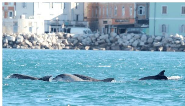
SLIKA 8 delfini

Po kosilu bo skupina odšla na panoramsko vožnjo z ladnjico na opazovanje delfinov. Gre za eno najbolj priljubljenih turističnih doživetij na slovenski obali, saj omogoča stik z naravo in