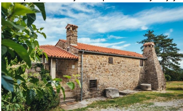
SLIKA 10 Tonina hiša