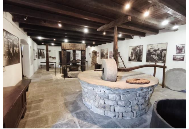
SLIKA 11 notranjost Tonine hiše

Z ogledom Tonine hiše se dan zaključí, in gosti se odpravijo nazaj Izole.