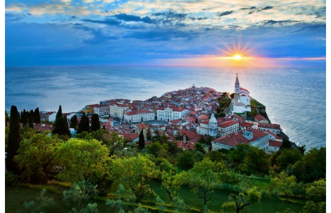
SLIKA 5 Piran

Nato pa se bodo po starih ozkih piranskih ulicah povzpeli do cerkve sv. Jurija, katera je zgrajena v beneško renesančnem slogu, arheološke raziskave pa potrjujejo, da naj bi bili ostanki že iz približno 6. ali 7. stol. Cerkev si bodo ogledali tudi v notranjosti saj je res prečudovita, po želji pa se bodo lahko podali po stopnicah do vrha zvonika. Po končanem ogledu cerkve si do skupina ogledala tudi piransko obzidje, nato pa bodo imeli čas za kosilo v restavraciji Srebrna vilica, katera ponuja raznoliko ter zelo okusno hrano.