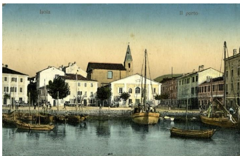
SLIKA 3 mandrač nekoč

Po prvi svetovni vojni je območje pripadlo Italiji na podlagi Rapalske pogodbe leta 1920. Sledilo je obdobje italijanizacije, ki je vplivalo na jezik, šolstvo in javno življenje. Po drugi svetovni vojni je območje postalo del Jugoslavije, leta 1954 pa je Londonski memorandum dokončno uredil mejo med Italijo in Jugoslavijo ter potrdil današnjo mejo slovenske obale.