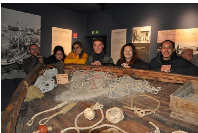
SLIKA 4 muzej Izolana

Prvo bom skupino odpeljala v muzej Izolana, kar predstavlja pomemben del ogleda saj bo to kot nekakšen uvod. V muzeju bodo spoznali zgodovino Izole zgodovino tovarne Delamaris in življenje ob morju nekoč, muzej pa je znan po prikazu ribiške pomorske in mestne dediščine, v kar spadajo stare fotografije izole, predmete vsakdanjega življenja nekoč, ribiško opremo, zgodovino ladjedelništva, prikaz mestnega razvoja in veliko več.