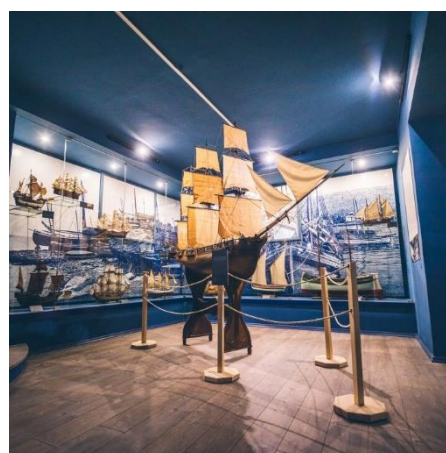
SLIKA 5 muzej Izolana2

Po ogledu Izole se skupina z avtobusom odpravi proti Piranu, kateri velja za najlepše ohranjeno srednjeveško mesto na slovenski obali. Njegov razvoj je zelo povezan z Beneško republiko, kar se vidi v arhitekturi, ozkih ulicah in mestnem trgu. Tam si bodo prvo ogledali Trtinijev trg, kateri je dobil ime po piranskem violinistu in skladatelju Giuseppetu Tartiniju, čigar kip stoji na tem trgu pred občinsko palačo. Današnji trg je pa do polovice 19. stol. bil mandrač. Na trgu si bodo ogledali Tartinijevo rojstno hišo, občinsko palačo, Benečanko.