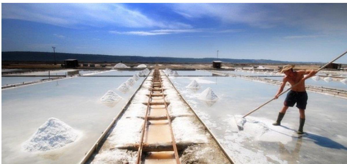
SLIKA 9 Sečoveljske soline

Nato se skupina z avtobusom odpelje do Sečoveljskih solin, ena najpomembnejših naravnih in kulturnih znamenitosti slovenske obale. Soline delujejo že več kot 700 let in so primer tradicionalne pridelave soli, ki se ohranja še danes. Tam bodo spoznali o zgodovini solinarstva, pripomočnikih ki so jih nekoč rabili, ogledali si bodo solinarska polja, izvedeli več o življenju solinarjev pa tudi naučili veliko novih izrazov in zanimivosti. Poskusili bodo razliko med navadno soljo ter solnim cvetom ter tako spoznali razliko. Sledil bo krajši čas za počitek pred nadaljevanjem poti proti zadnji točki današnjega vodenja.